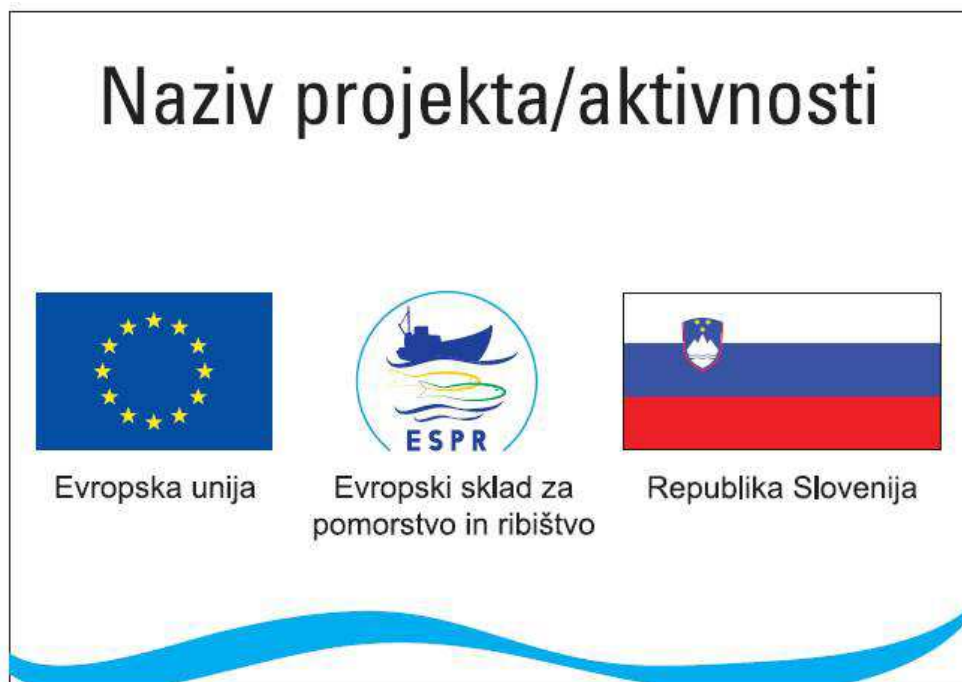
Slika 1: Primer stalne table / nalepke / kovinske ploščice

Nalepka / kovinska ploščica : dim. 70 x 35 mm, 100 x 50 mm, 150 x 75 mm, 210 x 297 mm