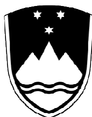
Črno-beli grb (varianta 1)