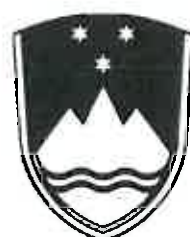
Črno-beli grb (varianta 1)