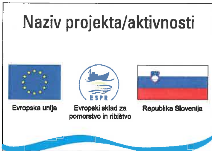
Slika 1: Predlog stalne table / nalepke / kovinske ploščice