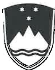
Črno-beli grb (varianta 1)