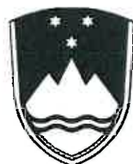
Črno-beli grb (varianta 1)